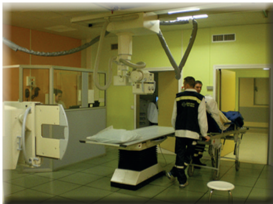
Salle de radiographie durée de l'examen entre 5 et 10 min